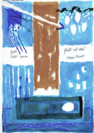
Der Tod des Mose und sein Vermächtnis*